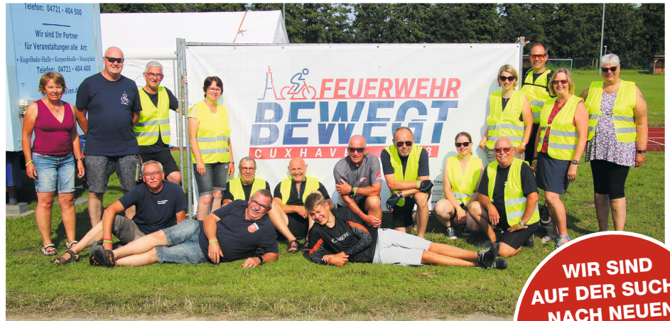
Feuerwehrmänner und -frauen aus Bad Münde und Springe waren in Cuxhaven bei „Feuerwehr bewegt“ am Start.

„Die sehr schön ausgearbeiteten Strecken führten an der Alten Liebe, der Kugelbake vorbei bis hin zur Insel Neuwerk“, berichten die Teilnehmer. An den Strecken waren mehrere Verpflegungsstationen eingerichtet, an denen sich die Feuer-