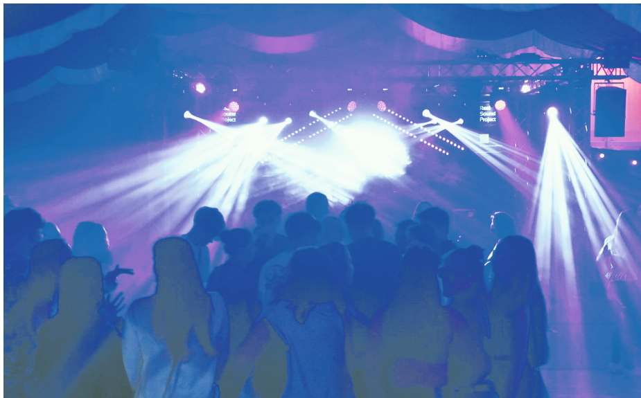
„Real Sound Projekt“ begeisterte das Bakeder Publikum mit fetten Beats und einer beeindruckenden Licht-Show.