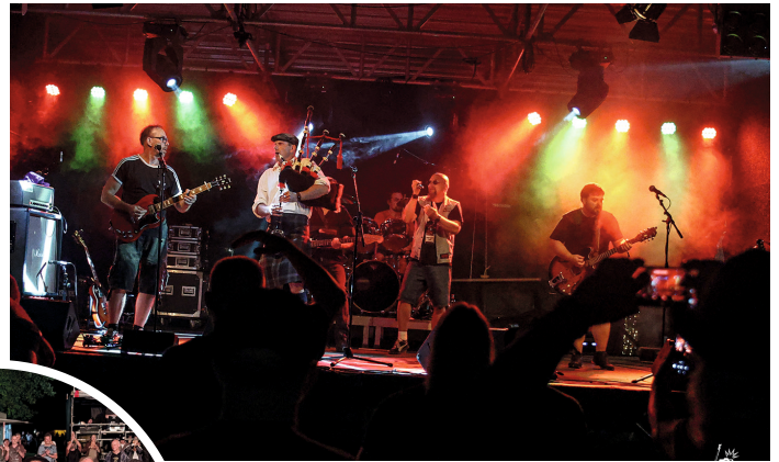
...so muss das! Passt.

Was für ein toller Tag. Viel besser hätte man sich das 5-jährige Jubiläum nicht vorstellen können. Das Wetter war traumhaft, die Bands haben mit super guter Laune beste Stimmung verbreitet, und unsere Gäste waren die besten die es nur geben kann.