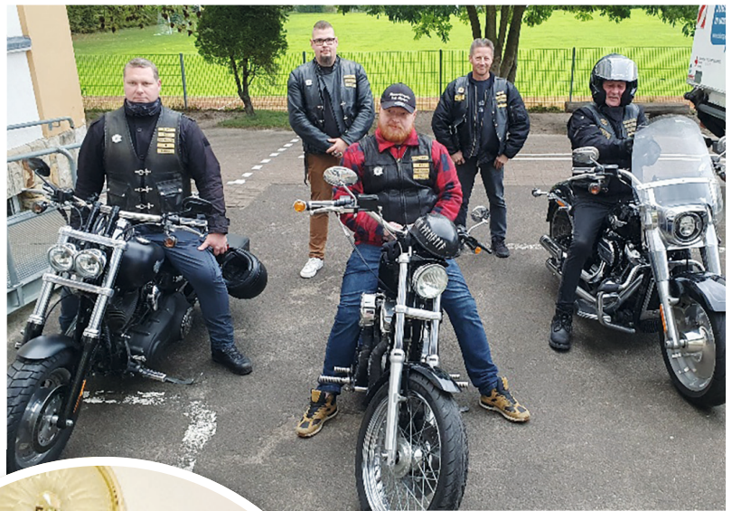
...und bietet die Gelegenheit zur Ausfahrt.

Sehr gefreut hat uns auch die Teilnahme der „Motorradfreunde Bad Münde“ am Blutspenden, die uns mit einer Abordnung besuchten und ordentlich „Lebenssaft“ gespendet haben. Vielen herzlichen Dank dafür. Als „Dankeschön“ hatten unsere aktiven Helferinnen vom Ortsverein wieder ein reichhaltiges Buffet gezaubert und die aktiven Helfer der Bereitschaft sich