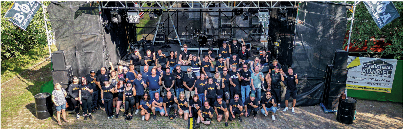
Das BOA-Team hat wieder ein Super-Festival auf die Bühne in Egestorf gebracht.

Bald wird es auch wieder eine Sammelaktion für die Obdachlosenhilfe in Hannover geben. Infos dazu gibt es dann auch auf unserer Homepage und in den sozialen Medien. Rock on... euer BOA-Team