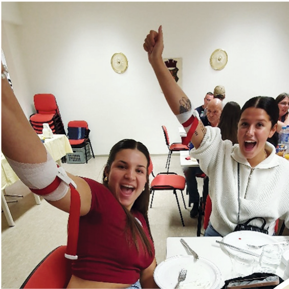
Der Blutspende-Termin wird zur Party...

Am 27. September führten wir wieder unsere Blutspendeaktion in Bakede in der Grundschule durch. Nach den Erfolgen der letzten Blutspendeaktionen konnten wir uns dank der zahlreichen Spendenden wieder einmal steigern. Diesmal durften wir 78 Spendende begrüßen, darunter 11 Erstspender. Der jüngste hatte gerade seinen 18. Geburtstag gefeiert und die älteste Erstspenderin war schon über 70 Jahre alt. Für dieses Engagement bedanken wir uns recht herzlich!