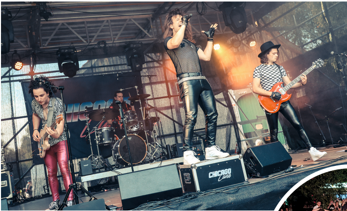
Rockende Bands, rockendes Fans...