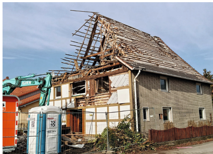
ZACK! Feierabend! Der Asbestfund in der Fassade lässt den Bagger still stehen.

Der gewonnene Raum, der durch die Entfernung des Hauses zur Verfügung steht, wird für einen Erweiterungsbau der Kindertagesstätte, sowie einen Spielbereich genutzt. Die baulichen Maßnahmen werden die bisherigen Platzprobleme beheben. Udo Lüders