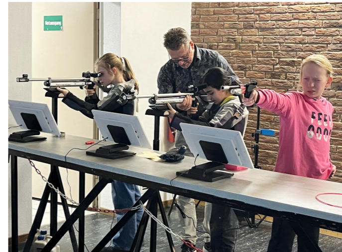
Die Jugend trainiert am modernisierten, elektronischen Schießstand im Bakeder Schützenhaus.