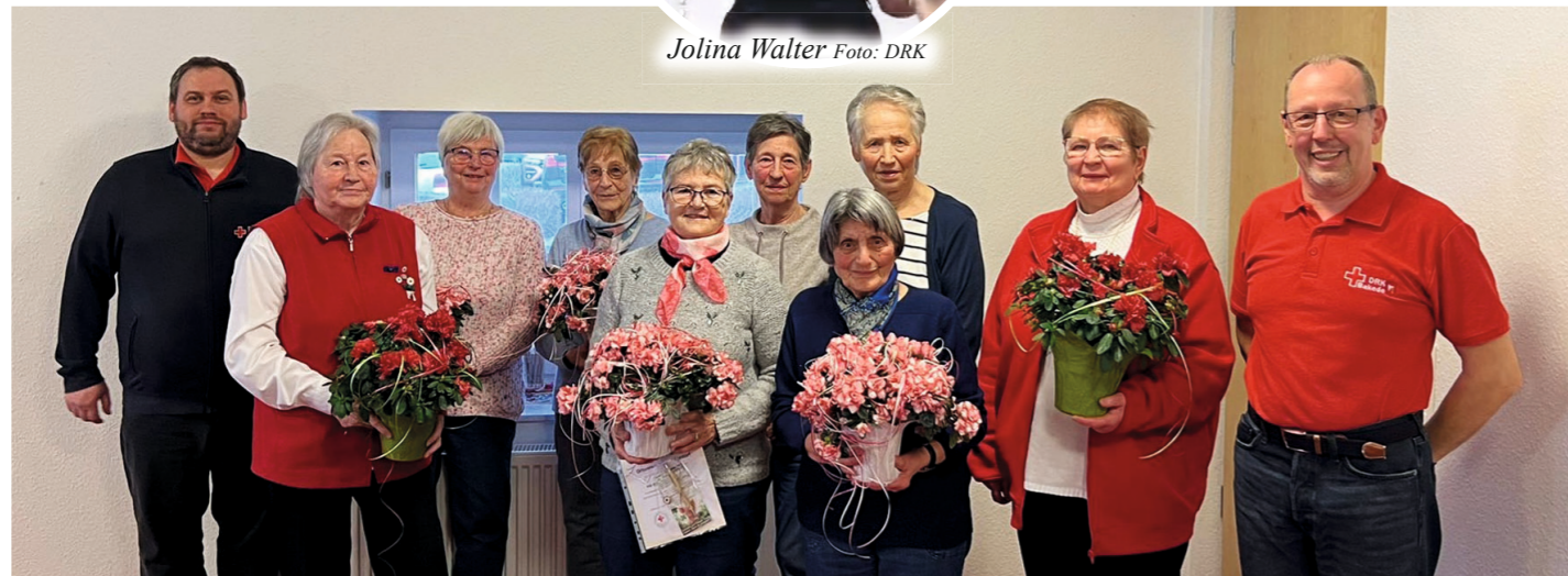
Im Rahmen der Jahreshauptversammlung wurden acht Personen für ihre langjährige Mitgliedschaft geehrt.

Die Grußworte vom Bürgermeister, stellv. Stadtbürgermeister und der FW rundeten den gelungenen Nachmittag bei Kaffee und Kuchen sichtlich ab und alle Anwesenden freuten sich über die Vielzahl der Angebote und Aktionen im DRK-Bakede. DRK